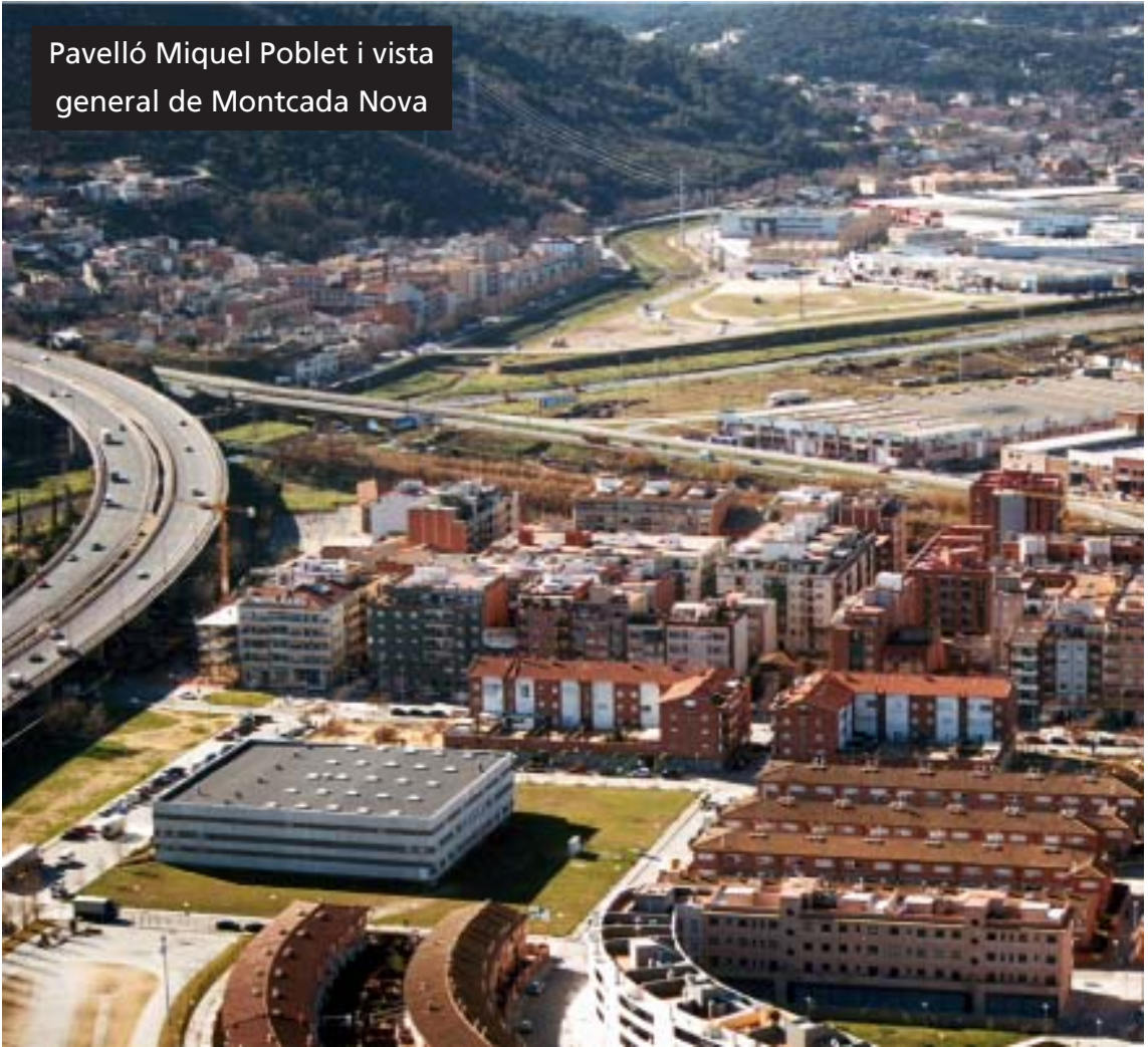
Pavelló Miquel Poblet i vista general de Montcada Nova