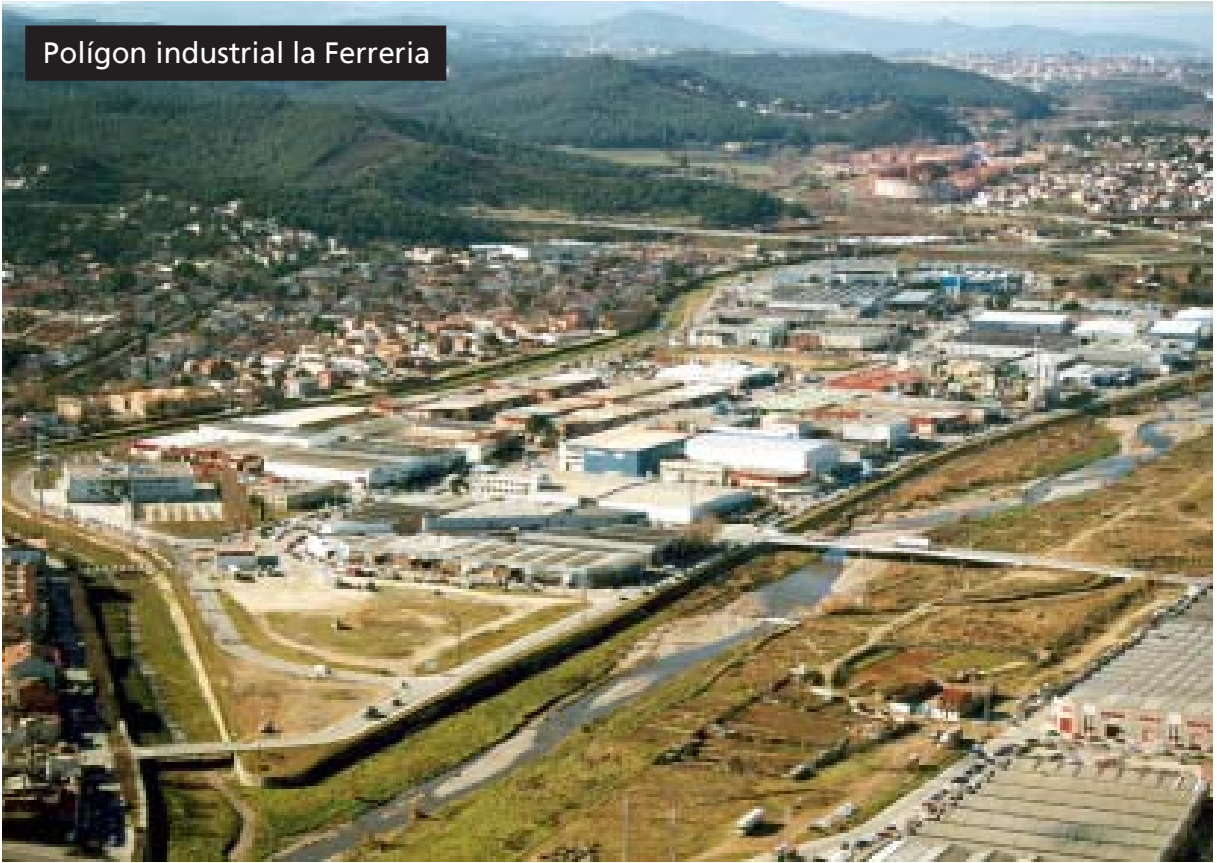
Polígon industrial la Ferreria