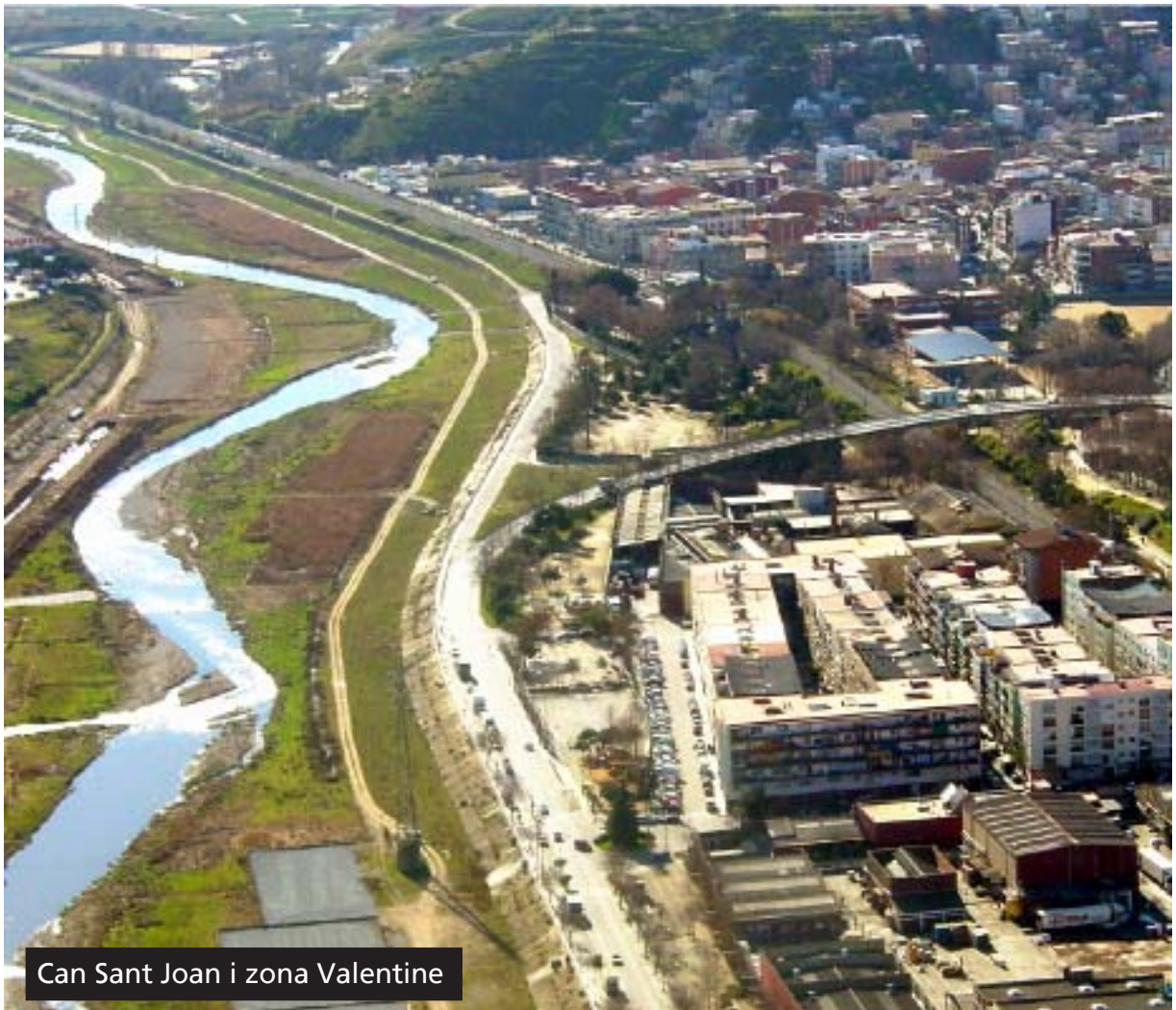
Can Sant Joan i zona Valentine