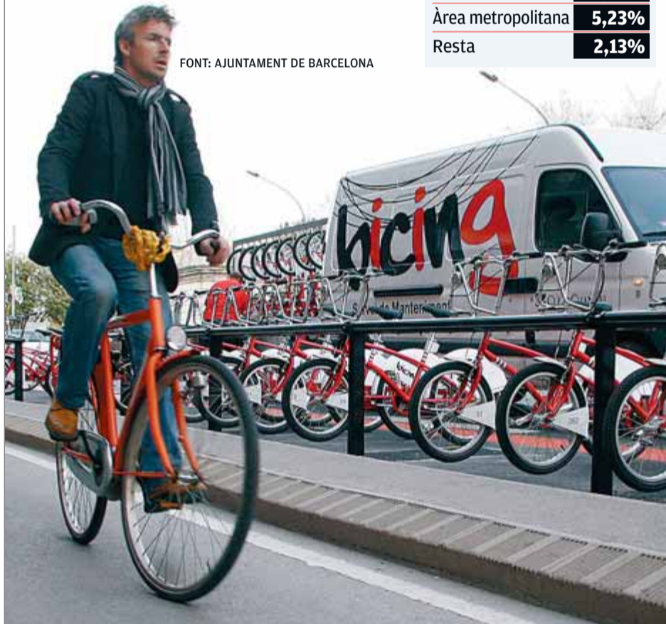
El Bicing doblarà el nombre de bicicletes el 2008